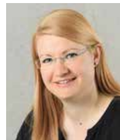
Liebe Leserin, lieber Leser

Der Verein ELCH wird durch das Sozialdepartement der Stadt Zürich unterstützt und ist als gemeinnützig anerkannt.